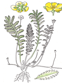
Luise Wiegand, „Gänsefingerkraut“, Pflanzenzeichnung. Über 150 dieser Zeichnungen von ihr haben sich im Forstbotanischen Garten erhalten.